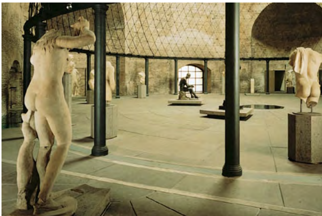
AULA OTTAGONA – TERME DI DIOCLEZIANO (EX PLANETARIO)

(in foto sullo sfondo “Il pugile” di Lisippo, anni addietro ivi esposto)